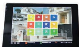
【NVR 本体】 KT-NVR3104W